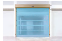
●衛生管理シャッター